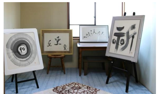
2階の3部屋にも展示