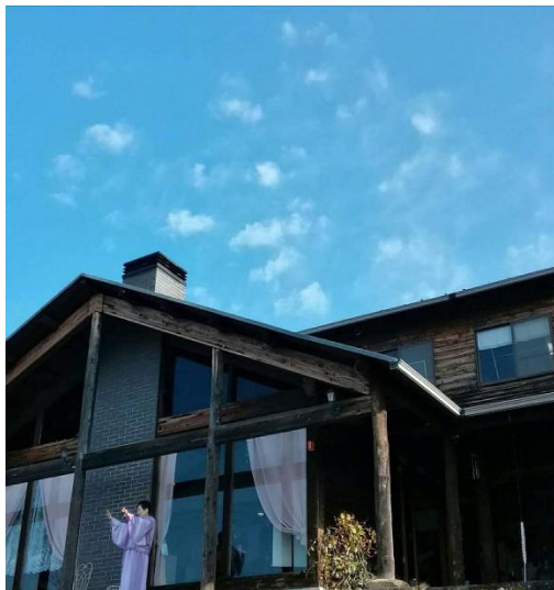
揮毫の後に、たくさんの龍の雲